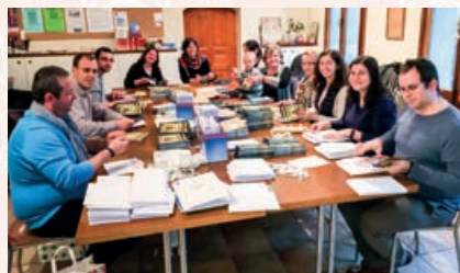
Tineri ajutând la expediția curierului parohiei, biserica din Gd-Lancy/Geneva, 2016