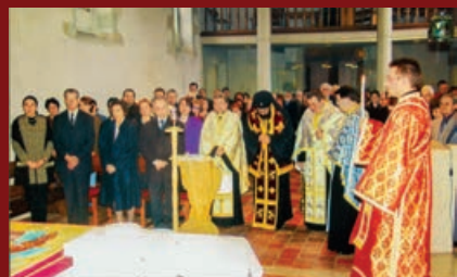
ML Regele și Regina la slujba parohiei ort. române de la biserica din Gd-Lancy/Geneva, iun. 1999