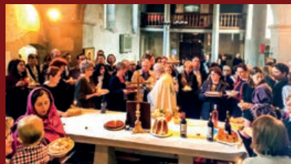
Slujba de pomenire a celor răposați, bis. Gd-Lancy/Geneva, 6. 11. 2016