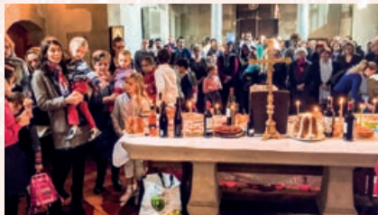
Slujbă la biserica din Gd-Lancy/Geneva, 2016