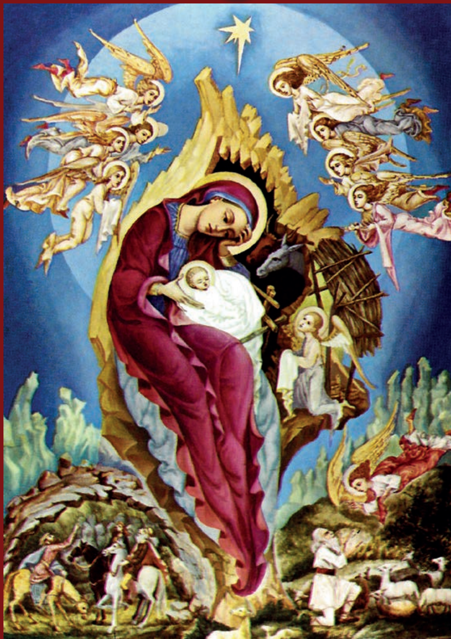
Nașterea Domnului, reproducere după un original al pictorului bis. Petru Botezatu