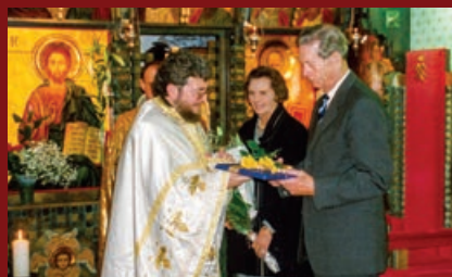
ML Regele și Regina la slujbă în capela românească din Lausanne, 8.11.1998