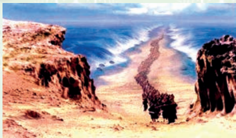
Moise împreună cu poporul său ieșind din Egipt - după 430 de ani de robie - spre libertate

cu Psalmii lui David, decât în politeismul grecesc, în care Zeus, Athena, Afrodita sunt doar personajele unor mituri de mult apuse.