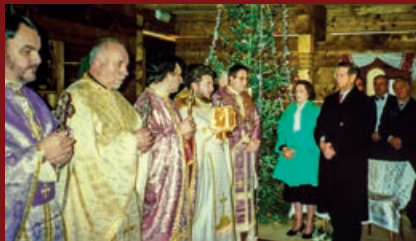
ML Regele și Regina la slujba de inaugurare a bisericii de lemn de la Chêne-Bourg/Ge, 25.12.1995