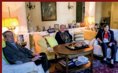
ML Regele și Regina la primirea Sfințelor Taine în casa regală de la Aubonne, 9.04.2015