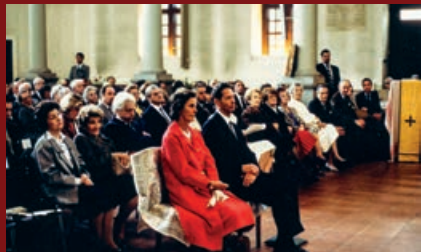
ML Regele și Regina la slujba parohiei ort. române de la Templul Fusterie Geneva - 1992