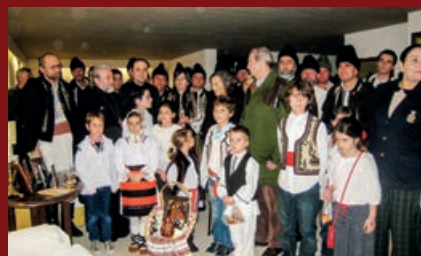
ML Regele și Regina în mijlocul colindătorilor de la parahiile Lausanne și Geneva, Aubonne - 15.12.2011