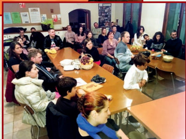
Întrunire cu tinere familii din parohie, biserica Geneva (Grand-Lancy), 5 nov. 2016