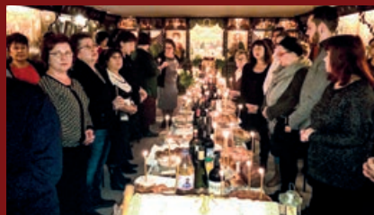
Slujba de pomenire a celor răposați, bis. Lausanne, 5. 11. 2016