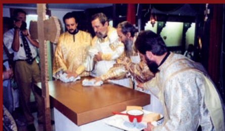
Imagini de la slujba de târnosire a Capelei ortodoxe dedicată "Tuturor Sfinților Români" de II.pp.ss. Mitropoliți Serafim, al Europei Centrale și de Nord, și Damaskinos, al Elveției ; Lausanne 16 iunie 1996