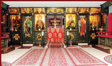
Iconostasul și tabloul votiv al capelei, executate de Maestrul Ion Ipser (Geneva), în așteptarea sfințirii ; Lausanne 16 iunie 1996