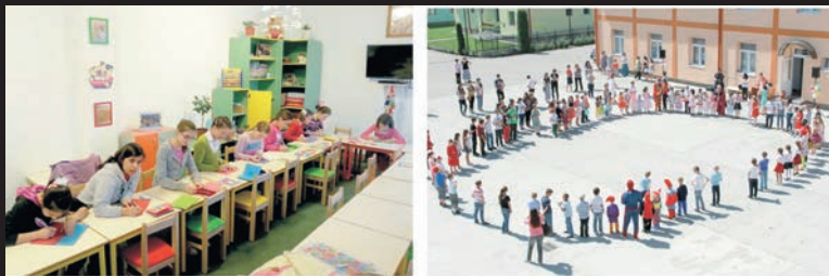
Activități ale copiilor