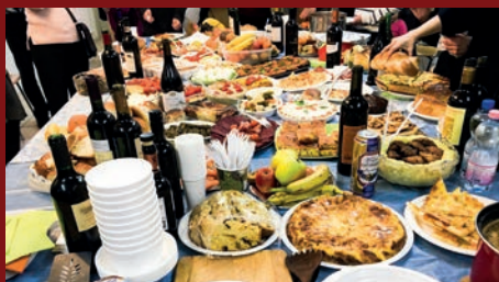
Slujba la bis. Geneva (Gd-Lancy), 6.12.2015, și pomenirea celor raposați (Sămbata Mortilor) la bis. Lausanne, 05.03.2016