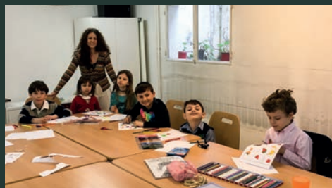
Copiii la Școala duminicală în bisericile din Geneva (Gd-lancy) și Lausanne, dec. 2015, mar.2016