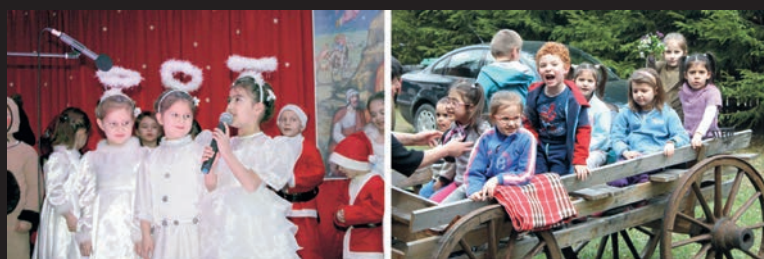
Activități ale copiilor