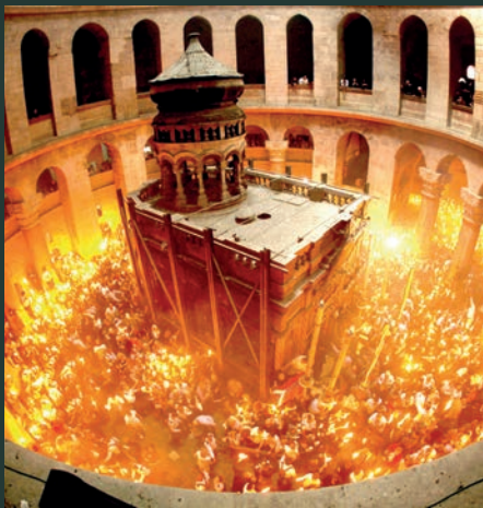
Sfânta Lumină la biserica Sfântului Mormânt din Ierusalim

Cele mai importante evenimente din istoria creației și din iconomia mântuirii omului sunt strâns legate de misterul "luminii dumnezeiești". Prin lumină Dumnezeu a făcut posibile toate lucrările Sale și tot prin lumină (lumina interioară a conștiinței) Creatorul ne revelează sensul și misterul acestor lucrări, ce fac parte din planul divin al transfigurării și îndumnezeirii omului și a creației.