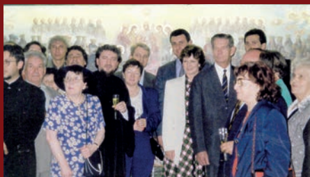
ML Regele Mihai și Regina Ana, însoțiți de AS regală Principesa Moștenitoare Margareta și de AS Principele Radu, la slujba de sfințire a Capelei românești din Lausanne, 16 iunie 1996