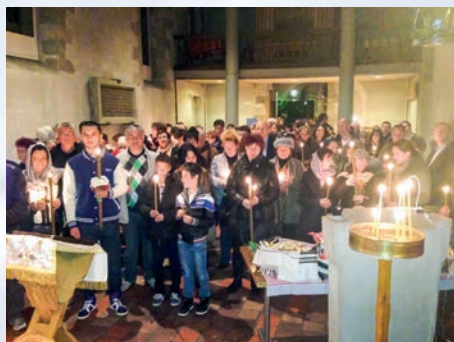
Slujbă pascală, biserica Geneva (Grand-Lancy)