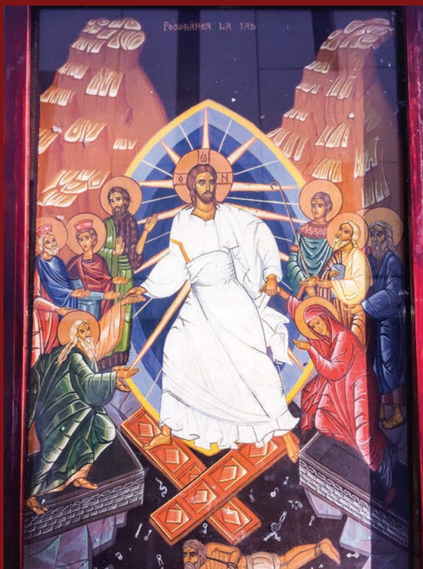
Icoana Învierii (biserica Lausanne, 1998)