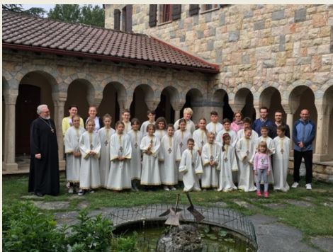
Tabăra de vară - Crêt-Bérard 2019

Mulțumim celor care v-ați înscris deja copiii (între 7 și 14 ani) și așteptăm și alți părinți să-și manifeste interesul pentru acest gen de activități ale bisericii noastre. < diaconu.adrian@gmail.com >