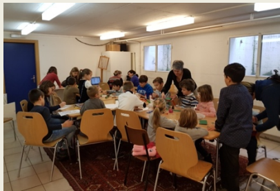
Copii la catehism, bis. Lausanne