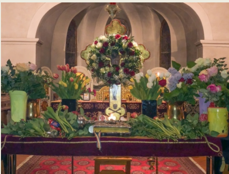
Sfânta Cruce străjuind Mormântul lui Hristos (Sf. Epitaf), în Sfânta și Marea Vineri, la biserica din Lausanne și la cea din Geneva

(dimensiunea verticală a Crucii), dar și între mine și semenii mei (dimensiunea orizontală a ei).