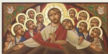
Cina cea de taină (icoană coptă)