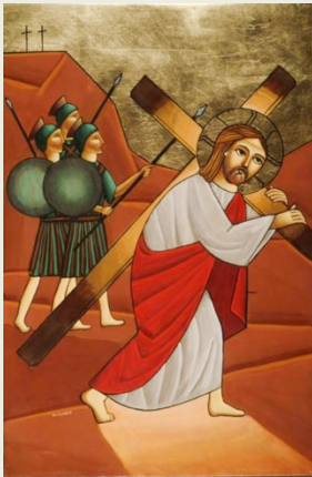
Le chemin de la croix