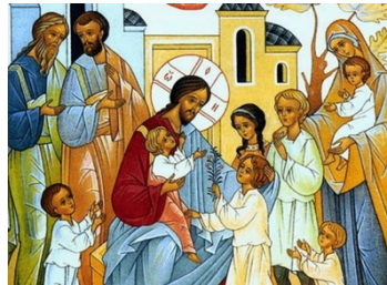
Lăsați copiii să vină la Mine ! (Luca 18, 16)

„Pentru o educație creștinească corectă sunt necesare trei lucruri: în primul rând, puține cuvinte, în al doilea rând, multe exemple și în al treilea rând, mai multă rugăciune” (Sfântul Paisie Aghioritul)