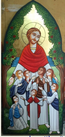
Isus protectorul copiilor (ic. coptă)