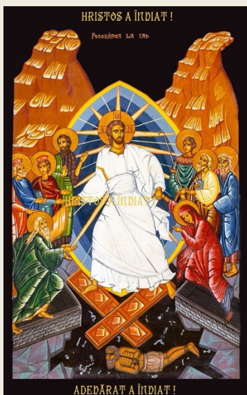
Icoana Învierii Domnului, Biserica Lausanne

Mais il est une faiblesse lourde à porter : la peur, qui nous accompagne sous diverses formes tout au long de notre vie. Or la plus imposante, d'où presque toutes les peurs prennent racine, est la peur de la mort.