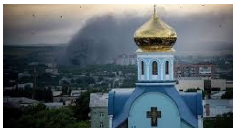
Ukraine : église orthodoxe au milieu des bombardements

Message du porte-parole de l'Église orthodoxe roumaine : Vasile Bănescu – (source: Orthodoxie.com du 5 mars – titre de la rédaction)