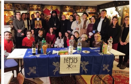
Imagini de la Întrunirile tinerilor NEPSIS-CH, bis. Geneva 1 nov. 2014 si bis. Lausanne 26.02.2022

gratuit; prețul pe care va trebui să-l plătești poate fi chiar propria ta libertate.